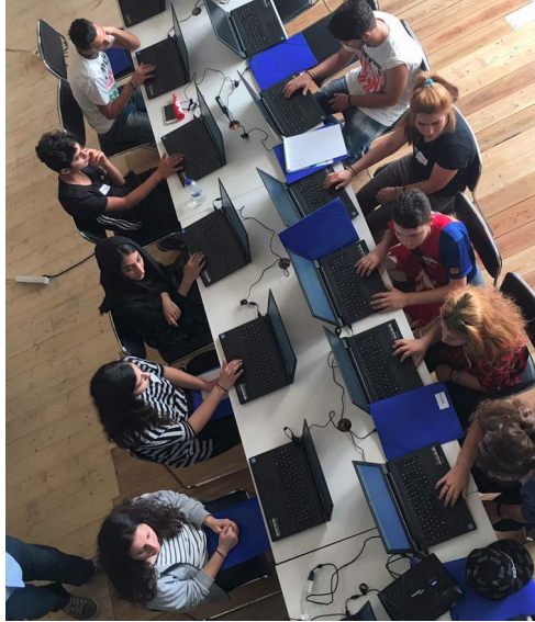
Εικόνα 2: Οι μαθητές την ώρα μαθήματος

Το λογισμικό, το περιεχόμενο, όλες οι εφαρμογές καθώς και τα ρομπότ είναι διαθέσιμα με άδειες ανοιχτού λογισμικού και τα ρομπότ που έχουν μέσο κόστος 50 ευρώ μαζί με τα τμήματα που τυπώνει ο κάθε μαθητής στον τρισδιάστατο εκτυπωτή τα παίρνουν οι μαθητές με την ολοκλήρωση των μαθημάτων για να τα προγραμματίζουν με τα κινητά τους.